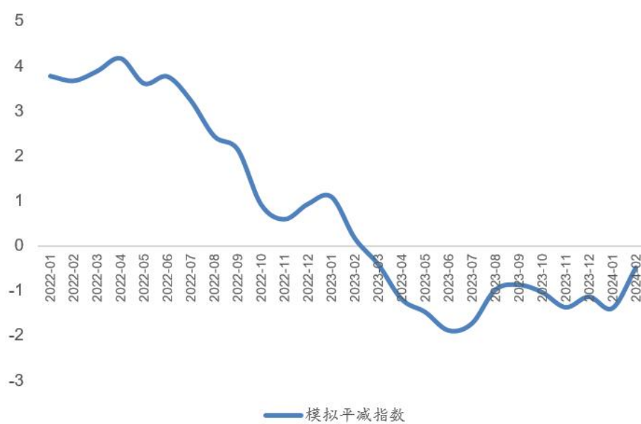
图3: 以65%和35%比重模拟的价格指数同比 (%)