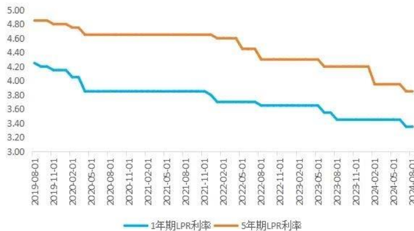
图 3: 2023 年以来 LPR 利率小幅多次调整

其次, 现有“稳健”货币政策基调与市场心理预期之间存在明显落差。2020 年至今, 即便是面临新冠疫情等外部重大冲击和内需不足, 货币政策基调也仅仅只是从“稳健中性”基调向保持稳健的货币政策“灵活适度”“灵活精准、合理适度”“精准有效”等偏松方向调微, 但总体基调仍是“稳健”。2023 年以来, 央行对 LPR 利率进行了多次调整, 如 1 年期 LPR 利率分别于 2023 年 6 月、2023 年 8 月和 2024 年 7 月下调了 10 个基点, 5 年期 LPR 利率分别于 2023 年 6 月、2024 年 2 月和 2024 年 7 月下调了 10 个、25 个和 10 个基点。除 5 年期 LPR 利率 2024 年 2 月由 4.2% 降至 3.95% 幅度稍大外, 其余降息幅度都很小。这与欧美国家连续降息时动辄 25-50 个基点, 甚至单次最高下调 100 个基点相比, 其象征意义多于实际意义, 与市场预期之间存在明显的落差, 因此小幅降息难以对市场产生明显影响。从加强预期管理、有效引导市场预期的角度看, 尽快对货币政策基调作出合理的、恰如其分的调整, 将有助于提振市场信心, 改变当前市场预期普遍偏弱的状况。