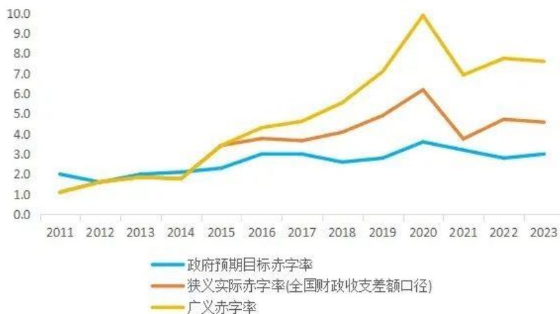
图4：不同口径的财政赤字率

需要搭配扩张性货币政策，通过增加货币供应量来抑制利率上行。近年来，我国财政政策基调明确定位于“积极的财政政策”，并提出要“加力提效”，整体偏向扩张。2023年全国财政预算赤字最初设定为3%，2023年10月对预算进行调整，增加了1万亿元超长期国债，最终财政赤字率达到3.8%。2024年，我国预算赤字率继续设定为3%，地方政府专项债券的额度安排为3.9万亿，较去年进一步增长，同时决定今年起连续几年大规模发行超长期特别国债。在财政政策基调明显扩张的同时，货币政策势必要给予积极配合，包括加大流动性供应，进一步降低利率水平等。此时货币政策基调就很有必要作出相应调整，由“稳健”调整为实质性的“适度宽松”。