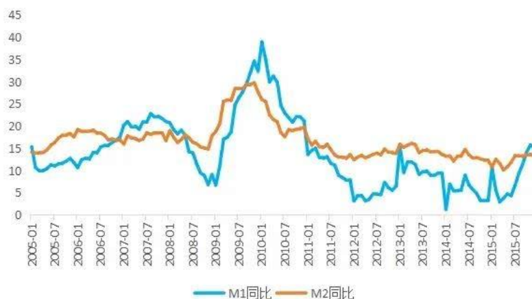
图 1：2009-2010 年货币供应量大幅增加